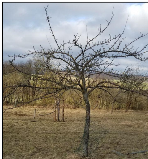
Verwahten Obstbäumen durch Pflege und Nutzung eine Zukunft geben - beispielhaft gezeigt auf der Streuobstexkursion.

Das Programm aus Exkursion, Vorträgen, Vorstellungs- und Diskussionsrunden wird ergänzt durch Stände unterschiedlicher Initiativen (Markt der Vielfalt), Ausstellungen rund um das Thema Streuobstwiesen und einer Verkostung von Streuobstprodukten. Abends wird die Veranstaltung mit einem gemeinsamen Streuobstwiesenkulturbuffet ausklingen (Klezmer-Band) und Raum für Vernetzung schaffen.